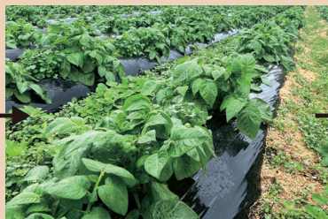
47日後：収穫前まで問題なくマルチとしての機能を果たしました。