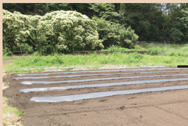
0日：マルチャーを使って展張しました。

様々な試験のもと4ヶ月の生分解速度と展延性の高い0.014mmフィルムの仕様を決定しています。