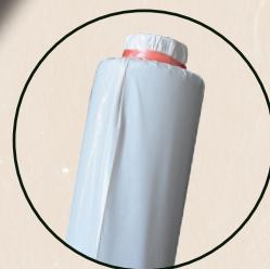
保管時の湿気防止用 PE 袋付き