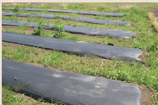
試験展張時の様子