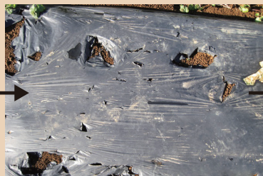
収穫後：分解が進行しています。