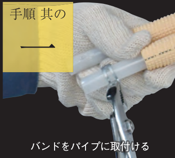
バンドをパイプに取付ける