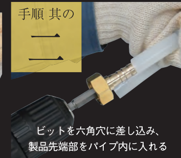
ビットを六角穴に差し込み、製品先端部をパイプ内に入れる