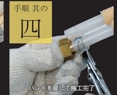
バンドを戻して施工完了