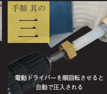
電動ドライバーを順回転させると自動で圧入される