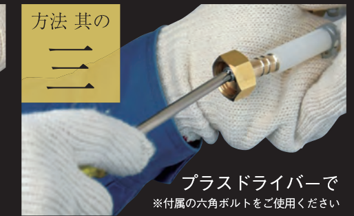
プラスドライバーで ※付属の六角ボルトをご使用ください