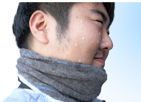
吸水性のあるタオル生地を採用