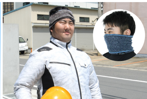
バンダナスタイルなど様々な使い方が可能