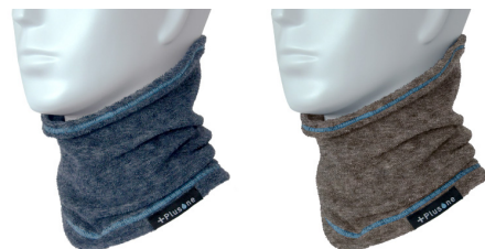
インディゴブルーとチャコールグレーの2色展開

「アツナイネック」は、建築現場で働く作業者の安全と快適さを追求した製品です。現場作業の方から、「夏は鉄骨が熱く、首にタオルを巻いて仕事をする」という声から商品企画。現場の暑さや危険性などの声を商品仕様に反映しました。新製品の発売に伴い、建築業界や作業現場における労働環境の向上に貢献することを目指しています。