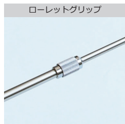
ローレットグリップ