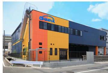
カラフルファクトリー外観