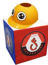
組分けヘルメット(手作り)