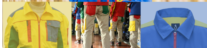
チーム大阪のユニフォーム