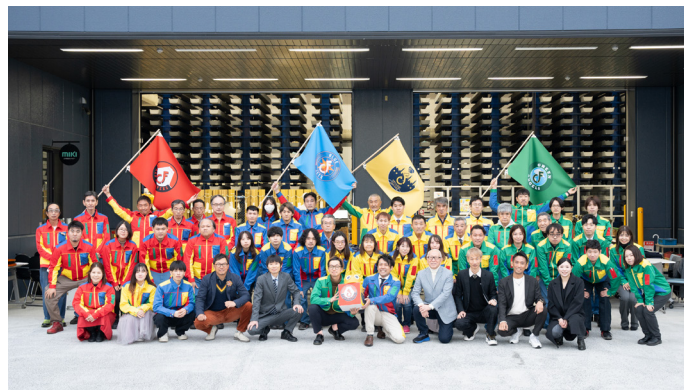
キックオフイベントの様子